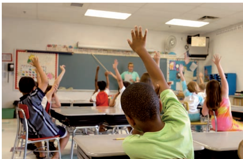
Lärare har mer betalt i Finland än i Sverige.

Det betyder att lönerna inte behöver vara lika för samma yrkesgrupp i olika länder.