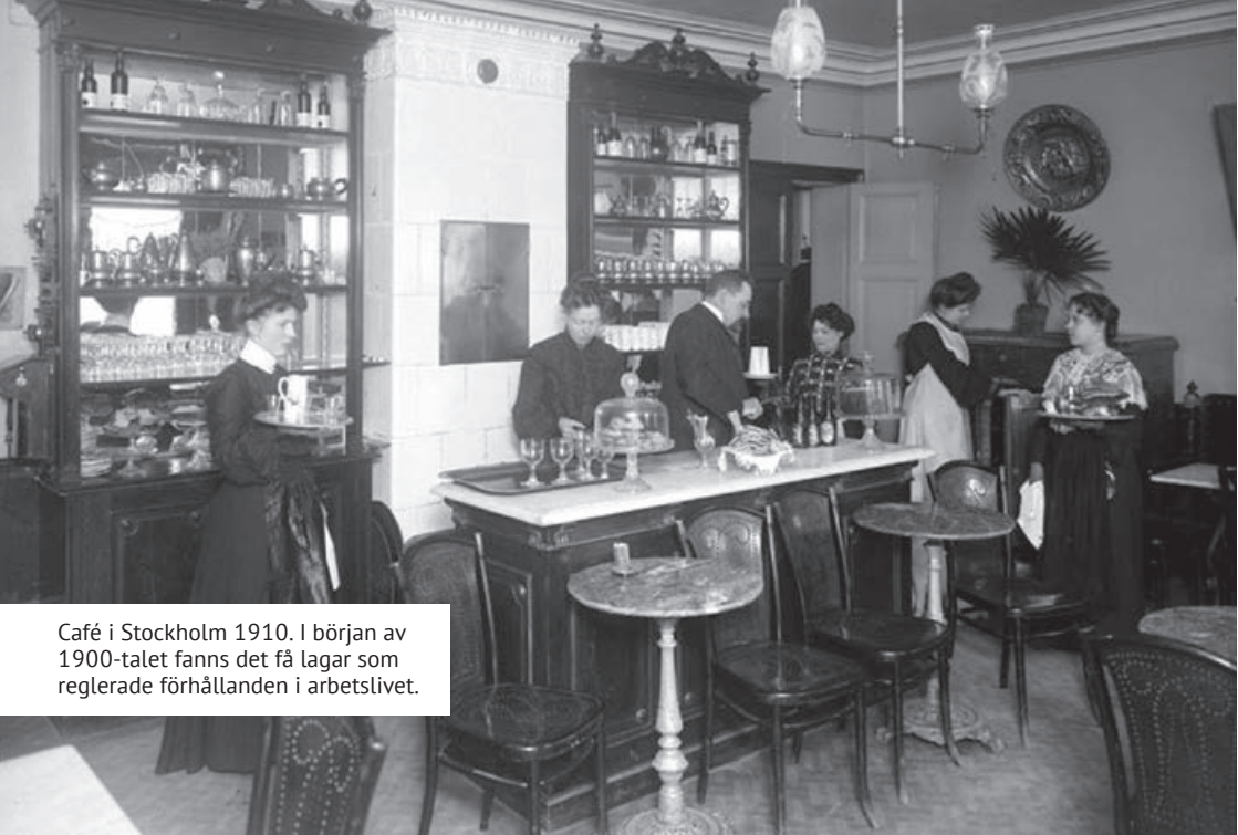
Café i Stockholm 1910. I början av 1900-talet fanns det få lagar som reglerade förhållanden i arbetslivet.