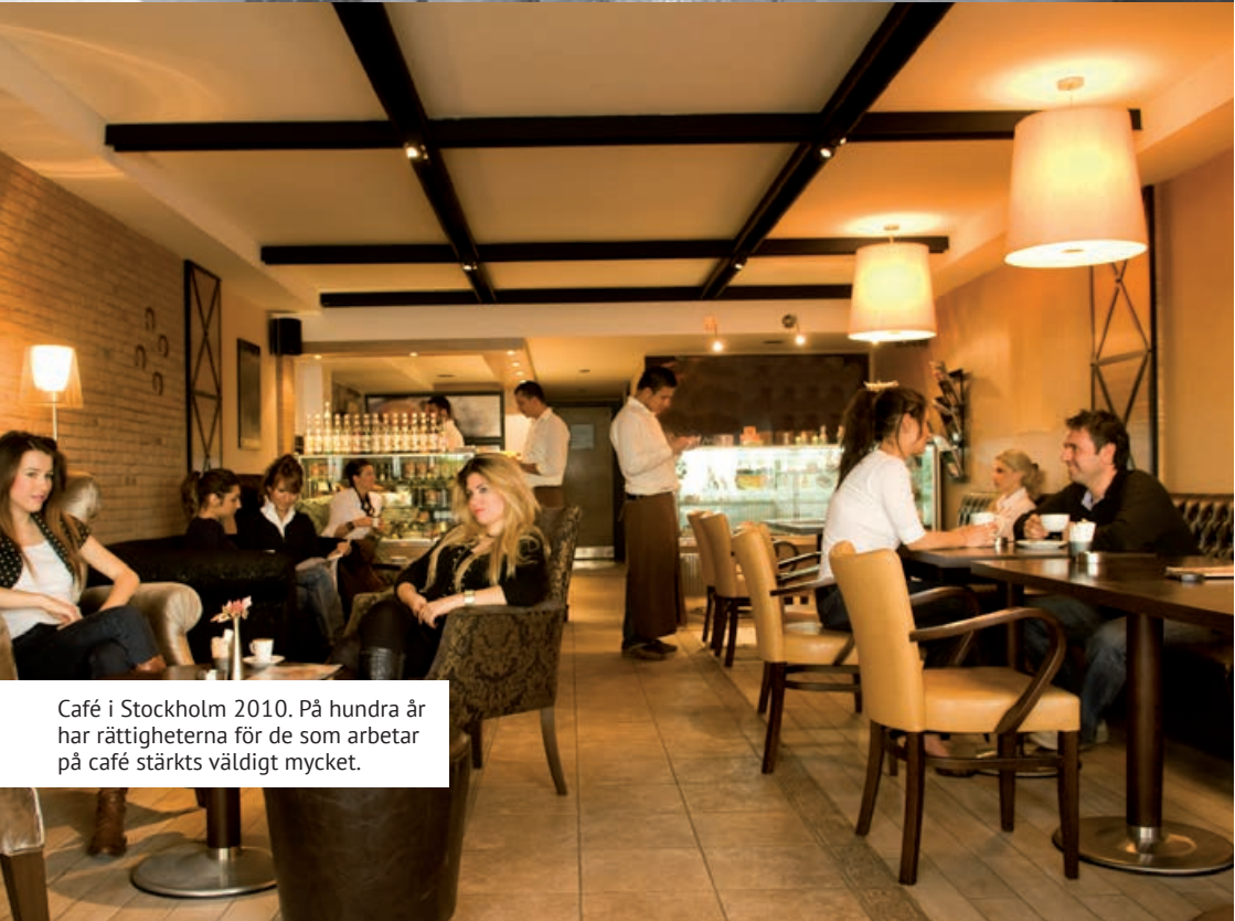
Café i Stockholm 2010. På hundra år har rättigheterna för de som arbetar på café stärkts väldigt mycket.