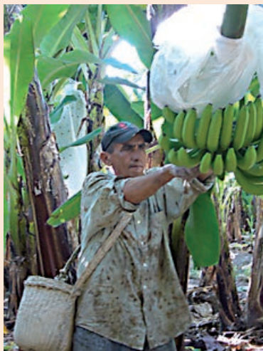
Skörd och hantering av rättvisemärkta bananer.