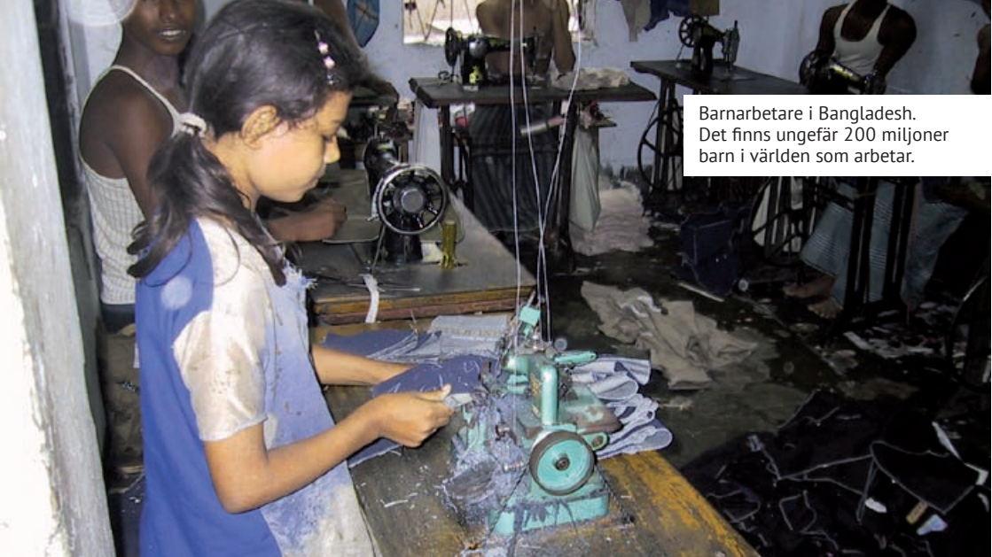
Barnarbetare i Bangladesh. Det finns ungefär 200 miljoner barn i världen som arbetar.